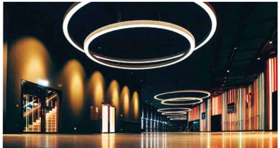
■ Hauptfoyer EG.