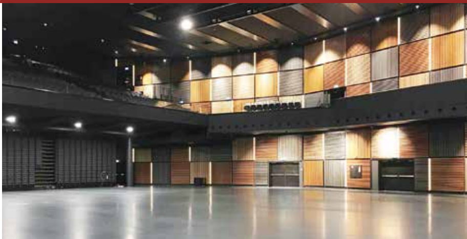
■ Grosse Halle mit Galerie.

In der modularen «Samsung Hall» sollen Kongresse, Konzerte und Geschäftsanlässe verschiedenster Veranstalter stattfinden. Sockelmieterin der Halle ist die Freikirche International Christian Fellowship.