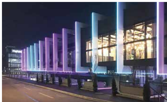
■ Perspektive von Bahnhof Stettbach. Bojana Kuzmanovic, eins Architekten AG